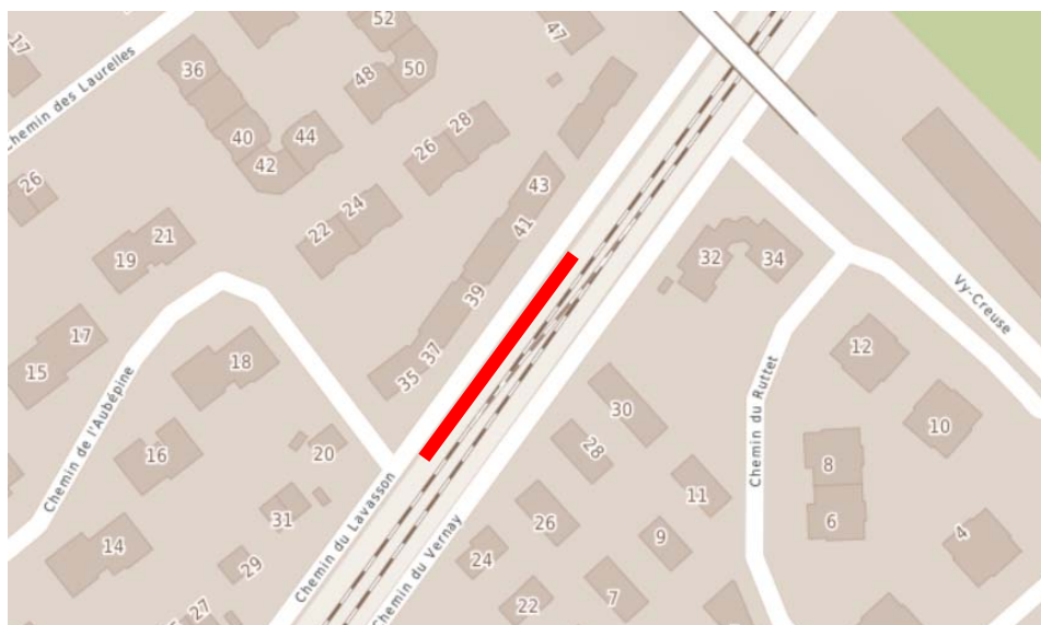
figure 1: plan de situation

Ces places seront délimitées par la clôture longeant la parcelle des CFF, afin d'éviter les débordements de véhicules contre la paroi anti-bruit. De plus, soucieuse de respecter l'environnement, la Municipalité a décidé de les réaliser en pavés filtrants, permettant la filtration des eaux dans le sol.