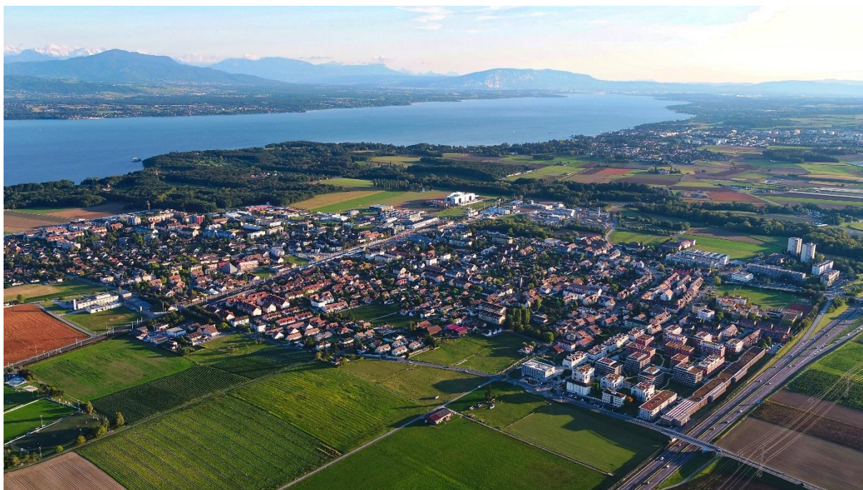
Ville de Gland.

Au niveau communal, la Ville de Gland, précurseur en intégrant le processus Cité de l'énergie en 2009, a adopté un programme d'actions dans le domaine de l'énergie visant la réduction de la consommation d'énergie et l'augmentation de la production d'énergie renouvelable à l'échelle de la ville. L'écoquartier Eikenøtt, situé au Nord-Est de la Ville, est déjà une solution éprouvée de cette volonté d'agir dans une direction qui favorise le développement des énergies renouvelables.