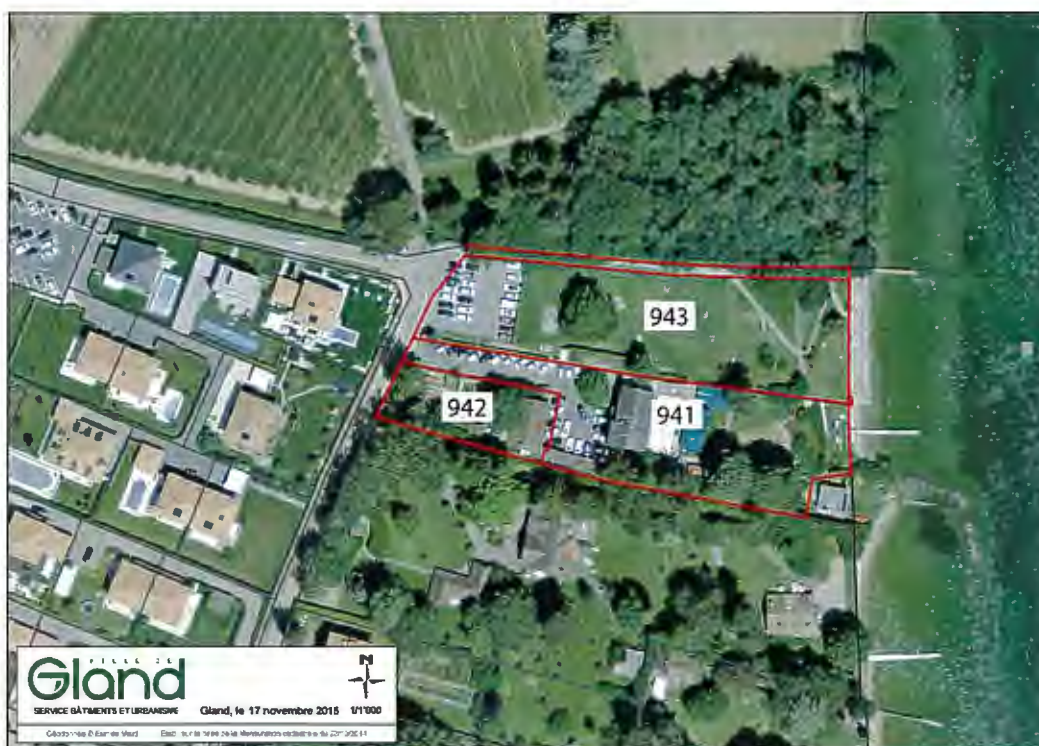
Figure 1: Situation parcelles communales

L'hôtel-restaurant de la Plage et ses dépendances se situent sur les parcelles n os 941 et 942 et couvrent une surface d'environ 3'800 m 2 (2'920 m 2 pour la parcelle n os 941 et 893 m 2 pour la parcelle n° 942). Ces parcelles sont colloquées, dans le plan des zones en vigueur, en "zone à occuper par plan de quartier". Ces parcelles font parties du PPA "Falaise III".