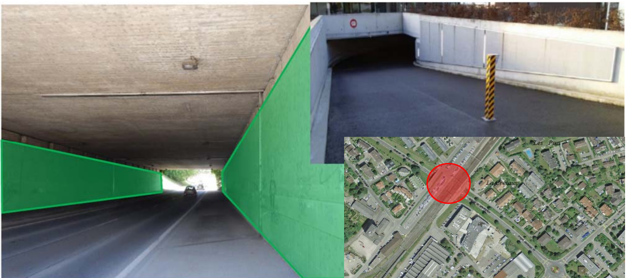
Figure 1: emplacement des panneaux antibruit et illustration de panneaux fixés mécaniquement

Les panneaux acoustiques sont des structures absorbant les ondes sonores. Ils diminuent considérablement les réflexions sur les surfaces lisses et atténuent ainsi la perception du bruit. Ils sont généralement composés de fibres minérales compressées et renforcées en surface avec de la fibre de verre pour proposer une résistance au vandalisme.