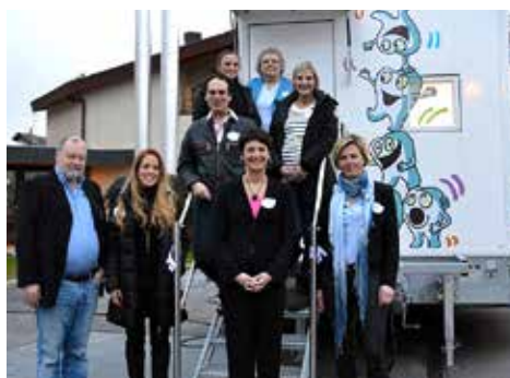
Le comité et le personnel soignant rassemblés devant la nouvelle caravane