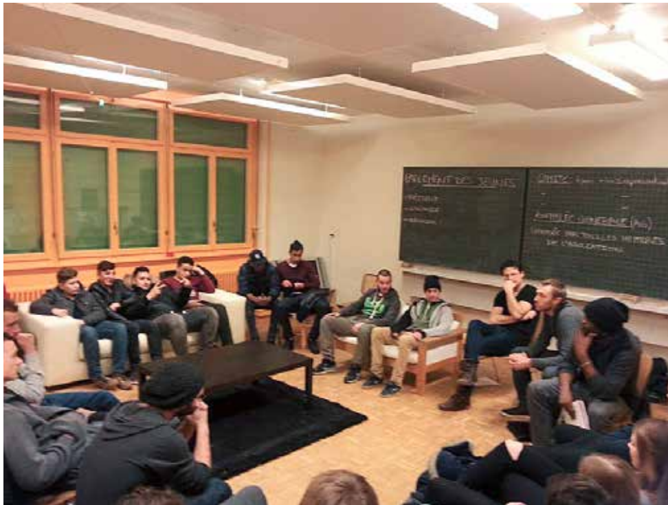
Lors d'une séance...