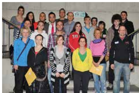
Les Mérites de l'année 2012

Le quotidien La Côte et Gland Cité présenteront les nominés dans l'une de leurs éditions puis consacreront un article sur les lauréats. Les propositions en vue de l'attribution de l'un de ces mérites sportifs sont à adresser au Greffe municipal, Grand Rue 38, d'ici au 22 février, dernier délai. Chaque lauréat reçoit un chèque de 1'000.- francs. Deux cents francs seront attribués à chaque candidature retenue (nominés).