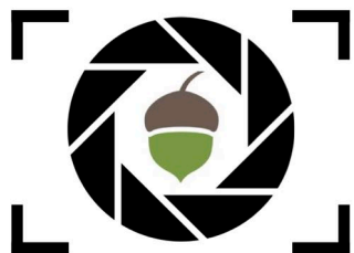
Photo Club Gland