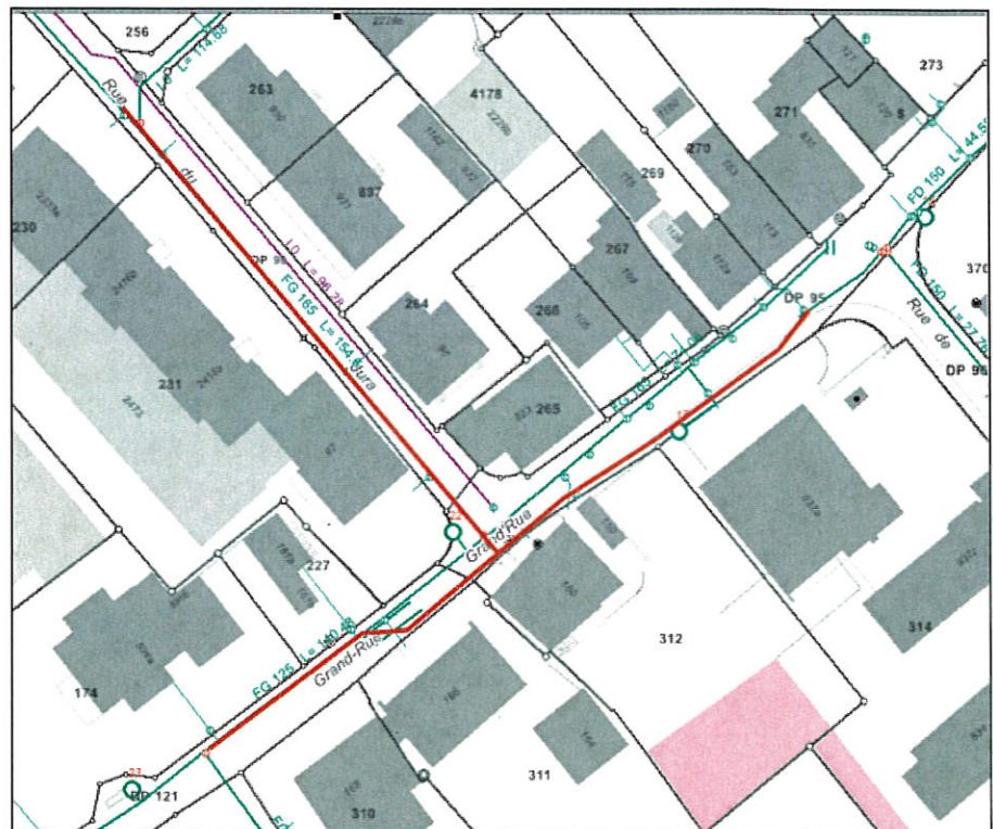
Figure 2 : Tracé des nouvelles conduites

Le réseau provisoire est réalisé soit par un système d'emboîtement (blutop), ce qui rend possible la réalisation des travaux en hiver. Lors des travaux du Vieux-Bourg, ces éléments constitueront le by-pass permettant le maintien des alimentations en eau du quartier. Ces travaux de sanitaires sont donc anticipés sur le projet global, ce qui rend leur investissement nul.