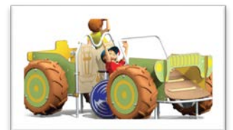
Figure 2 : " à gauche - wagon toboggan. à droite - Jeep"