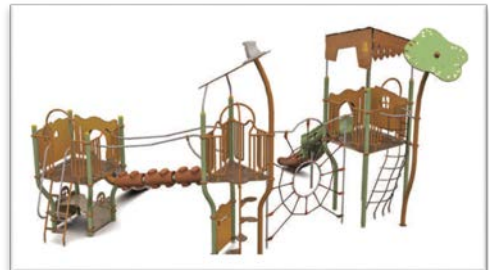
Figure 1 : "Cameleo Forestic"