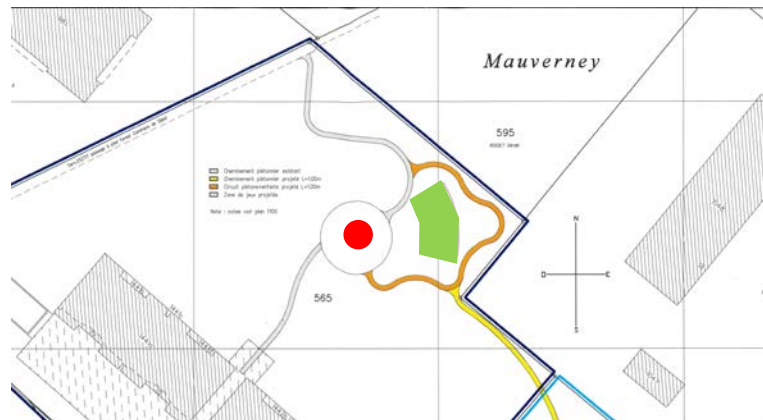
figure 8:à gauche - nouvel espace d'échange indiqué en rouge. à droite – nouvelle surface de sol en "Bioturf" indiqué en vert