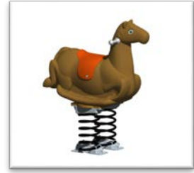
Figure 6 : "Cheval sur ressort"