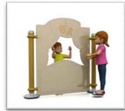
Figure 7 "solo+"