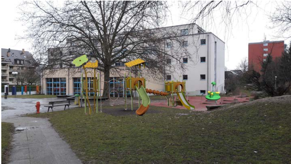
Figure 5 : photomontage de la future place de jeux