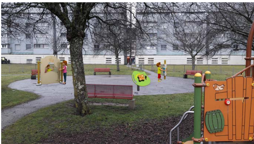
Figure 9: photomontage représentant le parc de Mauverney avec mise en scène des structures "Solo+"