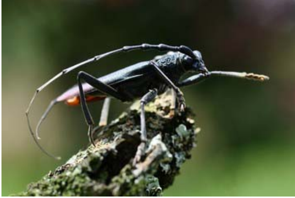
Grand capricorne (Cerambyx cerdo)