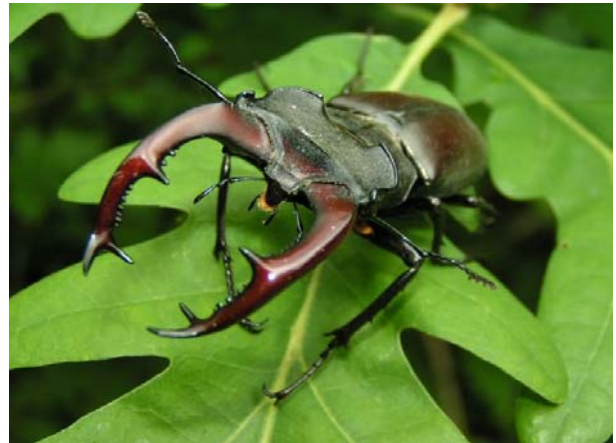
Lucane Cerf-volant (Lacanus cervus)

Les investigations de terrain menées en 2016 dans les 33 communes du secteur Lac-Pied du Jura ont mis en évidence la rareté de ces arbres-biotopes abritant ces deux espèces en raison du manque de renouvellement du patrimoine arboré et de ce fait la nécessité de les protéger. A cet effet, une réflexion a été menée par la DGE-BIODIV sur l'importance de compléter les règlements communaux de protection des arbres des communes du secteur. L'addendum proposé vise ainsi à encadrer les demandes d'autorisation d'abattage ou de taille de ces arbres, dans le but de les préserver et de favoriser leur renouvellement.