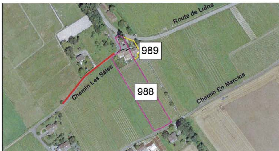
Figure 1: plan de situation.

Les parcelles n° 988 et 989 sont situées à l'extrémité nord de la Ville de Gland. Elles sont actuellement alimentées en eau par la Ville au moyen d'une conduite en PE de diamètre 25 mm sur environ 130 m. Il est important de souligner que cette conduite demeure l'unique moyen de distribution d'eau desservant ces deux habitations.