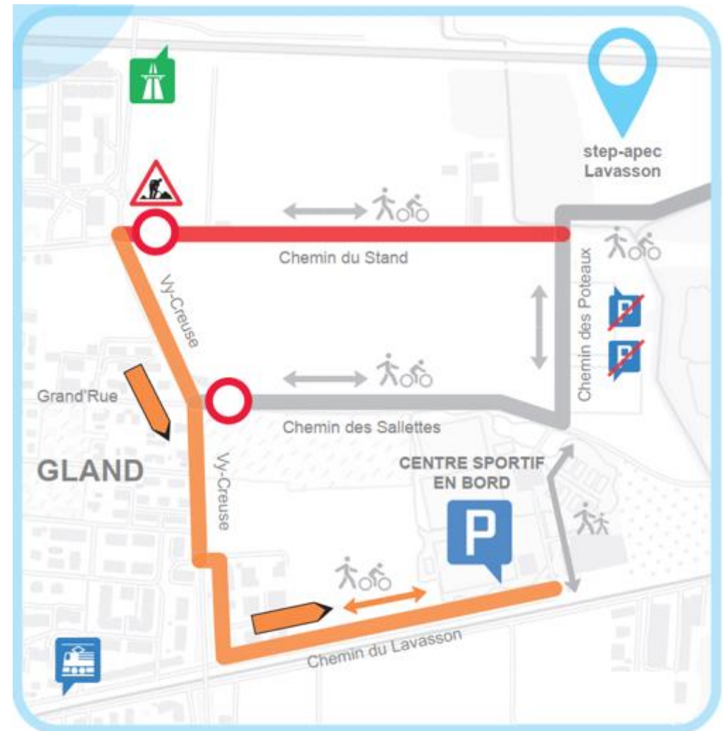
Travaux: Schéma de circulation