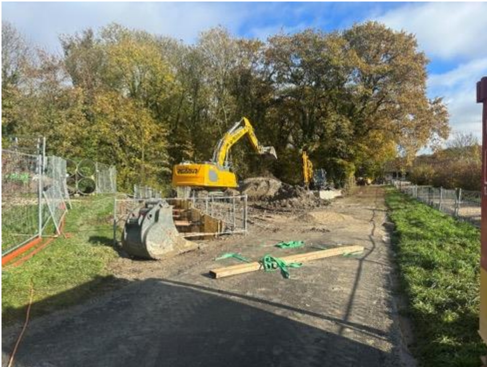
Travaux : creuse des réseaux chemin du Stand