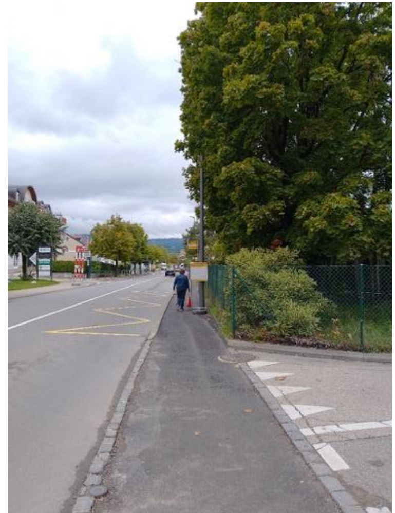
Travaux: avenue du Mont Blanc