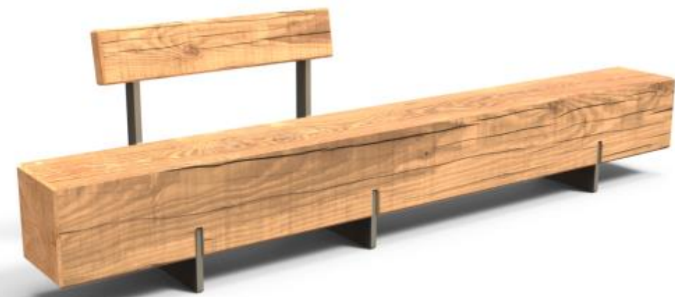
Image de référence - mobilier