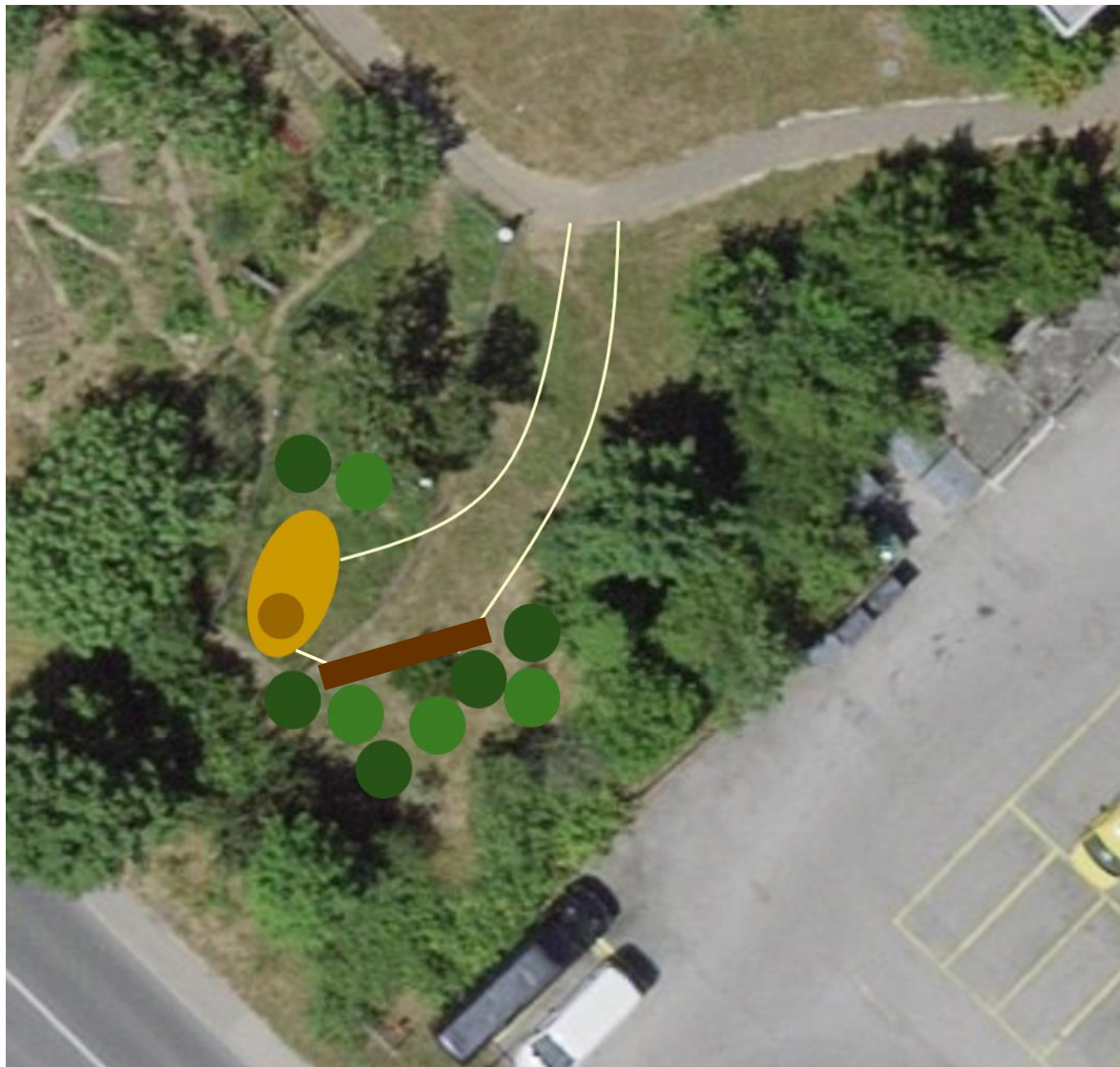
Parcelle n° 563 - jardin du souvenir projeté