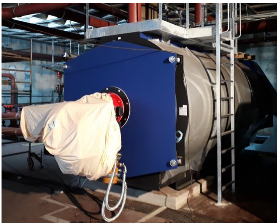
La nouvelle chaudière bicomcombustible.

Fin 2018, la centrale thermique de Cité-Ouest est en cours de rénovation. L'objectif est de remplacer l'ancienne chaudière par une chaudière bicomcombustible de 4.0 [MW] et de rénover les cinq sous-stations obsolètes. Il est important de préciser qu'aucune coupure de chaleur n'était possible pendant les travaux. Pour ce faire, l'ancienne chaudière a été gardée et intégrée dans le concept, le temps du chantier. A noter que cette unité de production sera facilement intégrable en tant que chaufferie secondaire ou d'appoint dans le cadre du futur réseau de ThermorésÔ.