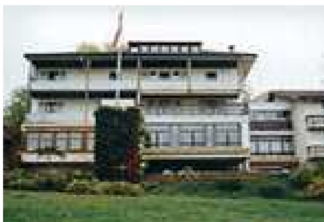
« Bellevue » exploitation