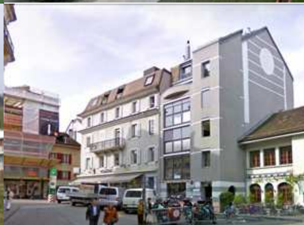
« La Clef des champs » exploitation et foncier